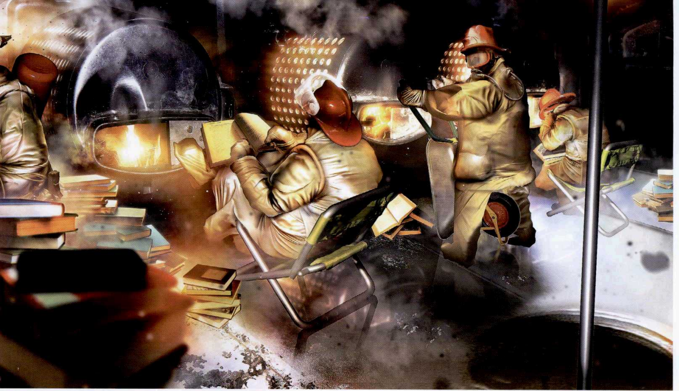
Ansen'in 2009 yılında yaptığı "Fahrenheit 451 - Respect to Ray Bradbury" isimli eseri sergide görülebilir.

"Görsel hafızamı, işlerimden okuyabilirsiniz... Kurgu olarak, durağanı değil anlatımcı bir tavrı tercih ediyorum, hikayeler anlatmayı seviyorum."