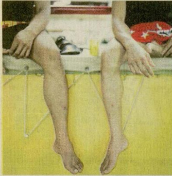
Türkkan, Muay Thai dövüşçüleri ile barlarda çalışan kadınların ortak geçim kaynağı olan 'beden' olgusunu sorguluyor.

Türkkan, kendi deneyiminden yola çıkararak gerçekleştirdiği çalışmasını şöyle anlatıyor: " Küçükliğimden beri hem kız hem de biraz erkek çocuğu özelliklerine sahiptim. Ergenlik döneminde ise kendi cinsiyetimden rahatsızlık duymaya başladım. " Bu cinsiyeti, ka-