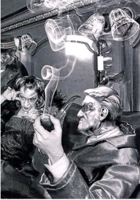
Ansen, 21. YY.'ın Mañ Ray'i olarak nitelendiriliyor.